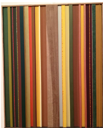
Gilberto Facchinetti, Partitura d'autunno , acrilico e legno su tela

in collaborazione con l'Associazione musicale "G. Rossini"